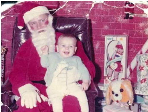
Bambin alors qu'elle est assise sur les genoux du père Noël

Tous ces changements sont très bien accueillis par les partisans du droit aux origines... à un détail près.