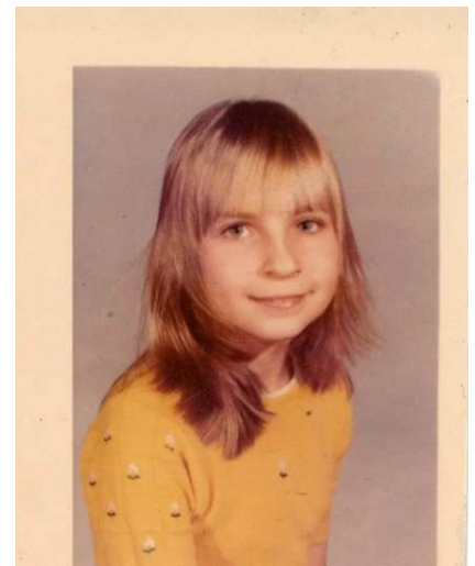
La fillette à l'âge de 12 ans