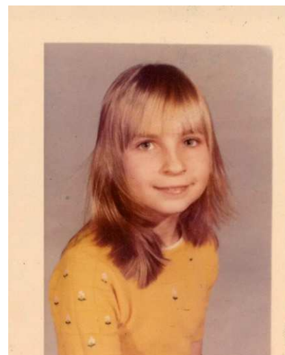
La fillette à l'âge de 12 ans