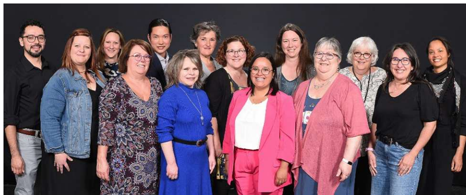
Un merci spécial à Patrick Deslandes, photographe ( www.patrickdeslandes.com )