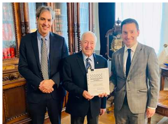
Photo prise lors de la sanction officielle, le 8 juin 2022